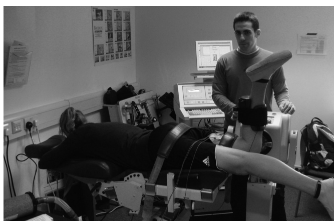
Fig. 2. Posición de valoración en decúbito prono con cadera fijada a 0^\circ de flexión y cabeza en posición neutra.

En cada sesión experimental, únicamente la pierna dominante fue evaluada 54 . Todos los participantes adoptaron como posición de valoración la de decúbito prono sobre la camilla del dinamómetro con cadera fijada a 0^\circ de flexión y cabeza en posición neutra (fig. 2) 55,56 . La posición de tendido prono ( 0^\circ de flexión de cadera) fue seleccionada en lugar de la extensivamente utilizada posición de sentado ( 80-110^\circ de flexión de cadera) por dos razones principales: