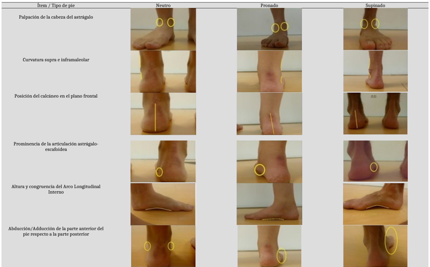
Figura 2. Diferenciación de los ítems del Índice Postural del Pie-6 en función del tipo de pie.